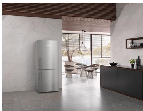
冷凍冷蔵庫 KFN 4776 ED