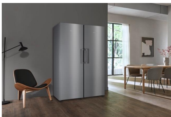
冷凍庫 FNS 4782 E (左)、冷蔵庫 KS 4783 ED (右)

ライフスタイルに合わせて選べるフリースタンディングモデル4機種 Miele のキッチン機器と共通の指紋のつきにくいクリンステール仕上げのステンレス 使いやすさを究めた無駄のないシンプルな設計