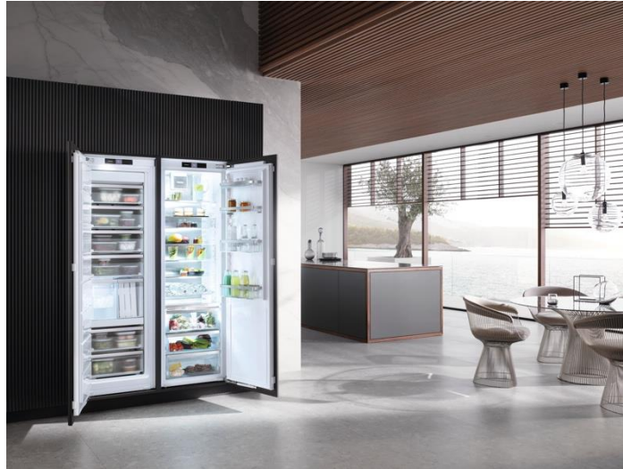
(左) 冷凍庫 FNS 7794 E、(右) 冷蔵庫 KS 7793 D

ビルトイン冷蔵庫「KS 7793 D」、ビルトイン冷凍庫「FNS 7794 E」を2024年末から出荷開始いたします。当製品は、キッチン家具に合わせたドア材を取り付けてビルトインすることでキッチンと機器が融合され、統一感のある美しいキッチン空間を実現。このうち、冷蔵庫「KS 7793 D」は、冷凍庫「FNS 7795 D」と合わせて左右に観音開きとなるように設置して、大容量の冷蔵庫と冷凍庫の組み合わせとしてお使いいただくことができます。