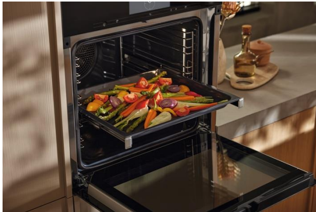
オーブンがあれば冷蔵庫で余った野菜や食材をグリルして簡単に美味しい一皿ができます。

今回の新製品は、デザイン・使い勝手の良さに加え、Mieleならではのキッチン機器同士の連携も強化され、よりサステナブルに快適にお使いいただけます。例えば、冷蔵庫の余った野菜をオーブンでグリル、野菜が熱いうちにマリネ液をかけ、冷ましてからオーブントレイに入れたまま冷蔵して野菜マリネにしたり、焼く前に冷やす工程が必要なお菓子作りは生地をオーブントレイに入れて冷やしそのままオーブンに入れたり、冷蔵庫とオーブンの家事動線を最大効率化し、フードロスも削減。また冷蔵室のドア棚は食器洗い機対応なので、お手入れも簡単。