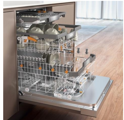
食事の後片付けは大容量の食器洗い機におまかせ。

Mieleはまず食器洗い機をご検討いただくことが多いですが、冷蔵機器やオーブンもお使いいただくことでその性能を最大限に引き出すことができるように設計されています。理想的な食品保存、フードロスの削減、簡単で美味しい調理、食後の後片付けをMieleにまかせて、空いた時間を自分や大切な人のために使う--「Mieleのある暮らし」をもっと楽しんでいただくために、Miele食器洗い機やオーブンと一緒に、Mieleの冷蔵庫もキッチンに迎えていただくことをご提案します。